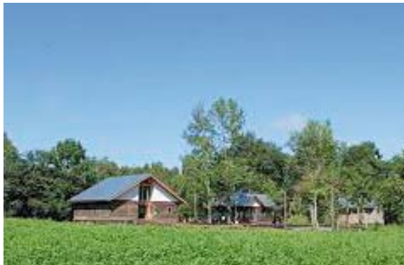
Photo. 6 Rokkanomori-Sakamoto Naoyuki Kinenkan (Nakasatsunai, Hokkaido). 六花の森 (坂本直行記念館) (中札内村)