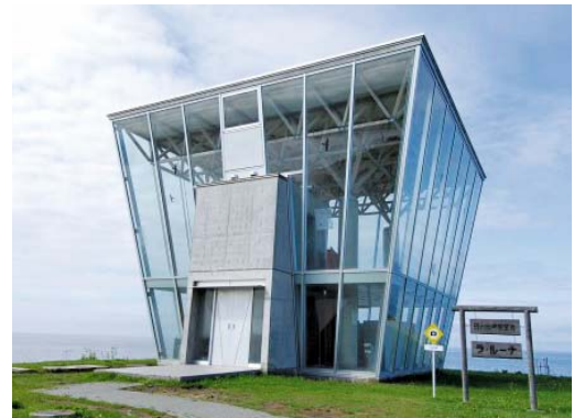
Photo. 7 Observatory at the top of Hinode peninsula (Oumu, Hokkaido). 日の出岬展望台 (雄武町)